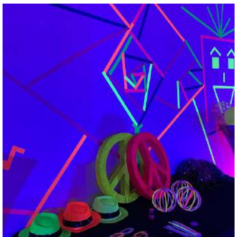
Thème: Fluo Party