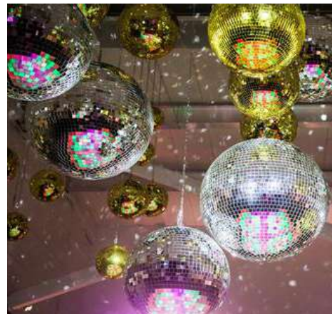
Thème: Disco- Année 80