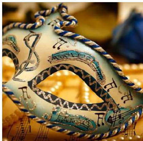
Thème: Bal masqué/ vénitien