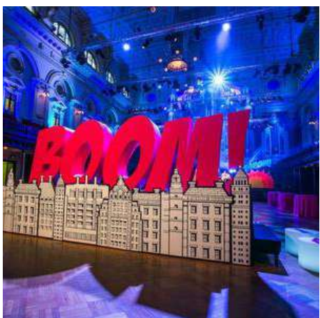
Thème: Super héros