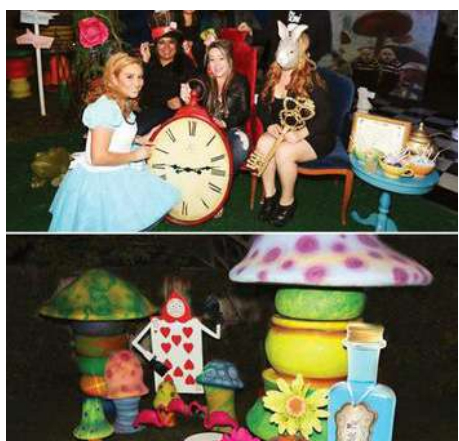
Thème: Alice au Pays des Merveilles