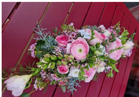
Centre de table